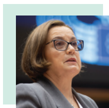
Paní Ana Paula Zacariasová, portugalská ministryně pro záležitosti EU za rotující předsednictví Rady Evropské unie