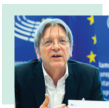
Pan Guy Verhofstadt, poslanec Evropského parlamentu

Společnému předsednictví je nápomocna Výkonná rada , které společně předsedají všechny tři orgány.