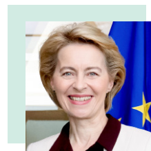
Ursulou von der Leyenovou, předsedkyní Evropské komise

kteří budou působit jako její společné předsednictví .